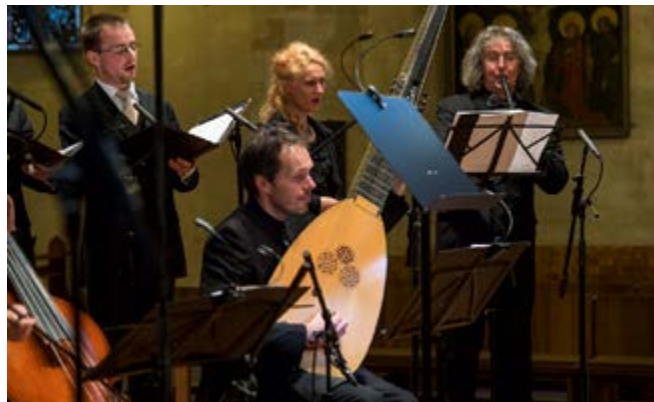
Johann Rosenmüller Ensemble