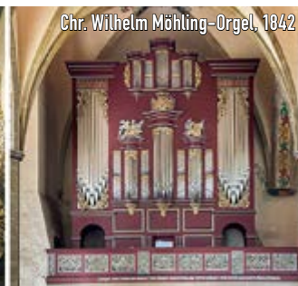
Chr. Wilhelm Möhling-Orgel, 1842