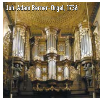
Joh. Adam Berner-Orgel, 1736

Kostenbeitrag pro Teilnehmer: 60,- € inkl. Besichtigung, Imbiss, Kaffee, Kuchen und Konzerteintritt Anmeldung und Information im Festivalbüro oder bei der Gesellschaft der Musikfreunde e.V.: info@musikfreunde.org oder unter der Telefonnummer: 0160-158-1122 (Herr Jansen)